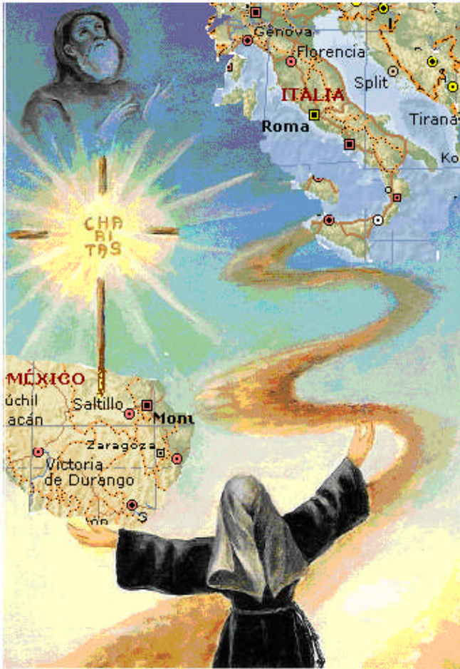
Viviendo el Evangelio al estilo de San Francisco de Paula Monjas Mínimas de Saltillo